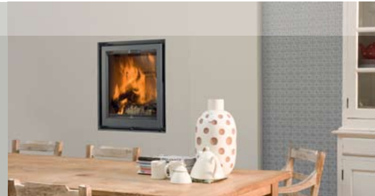
Unilux-3 55 - frameless