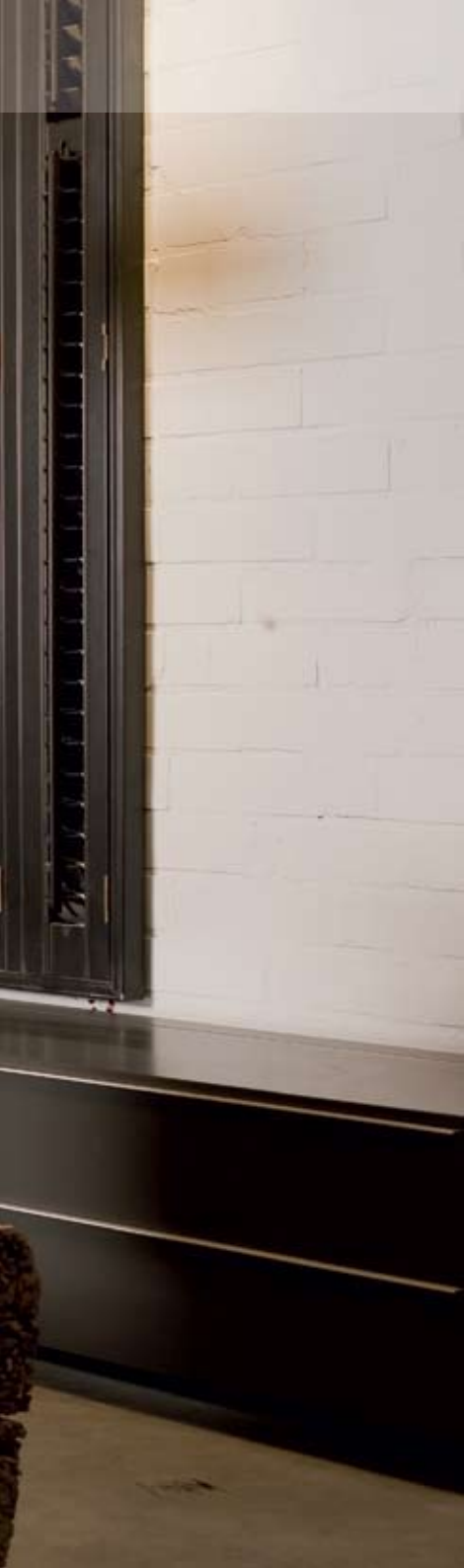
Unilux-3 55 - 4-sided frame